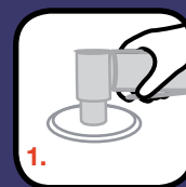
1. Slipa - P60 - P120

Återvinn. Tryckt i Storbritannien. © 3M 2007 Copyright. BR12 0092-1