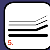
5. 2 tunna lager