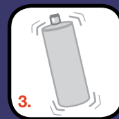
3. Skaka flaskan i 1 min